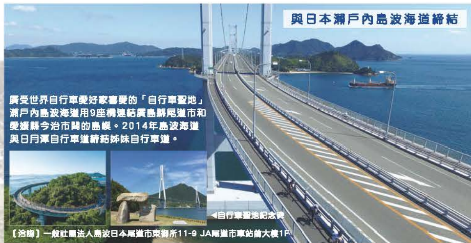
與日本瀨戶內島波海道締結

廣受世界自行車愛好家喜愛的「自行車聖地」瀨戶內島波海道用9座構造結實島嶼間市和愛媛縣今治市間的島嶼。2014年島波海道與日月潭自行車道締結姊妹自行車道。