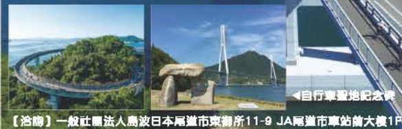
Cycling Shimanami(島波海道自行車大會)

廣受世界自行車愛好家喜愛的「自行車聖地」瀨戶內島波海道用9座構造結實島嶼間市和愛媛縣今治市間的島嶼。2014年島波海道與日月潭自行車道締結姊妹自行車道。