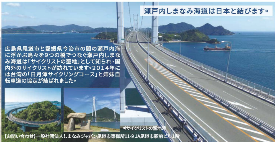
瀬戸内しまなみ海道は日本と結びます。

広島県尾道市と愛媛県今治市の間の瀬戸内海に浮かぶ島々を9つの橋でつなぐ瀬戸内しまなみ海道は「サイクリストの聖地」として知られ、国内外のサイクリストが訪れています。2014年には台湾の「日月潭サイクリングコース」と姉妹自転車道の協定が結ばれました。