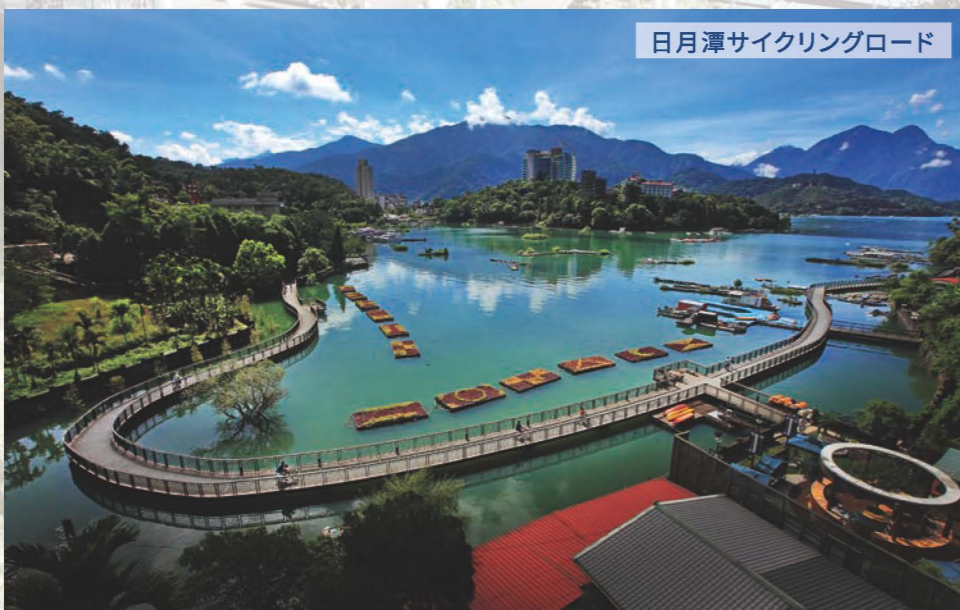
日月潭サイクリングロード